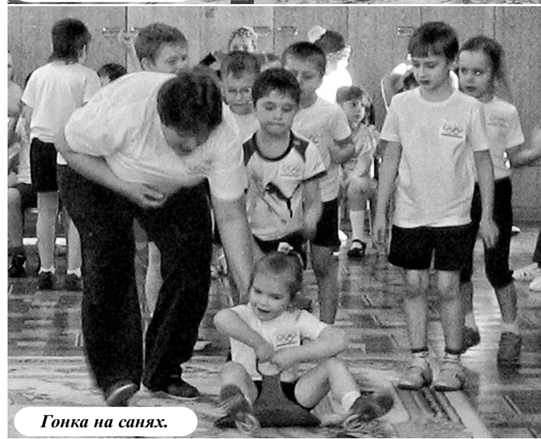
Гонка на санях.